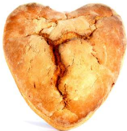
CUORE DI PANE